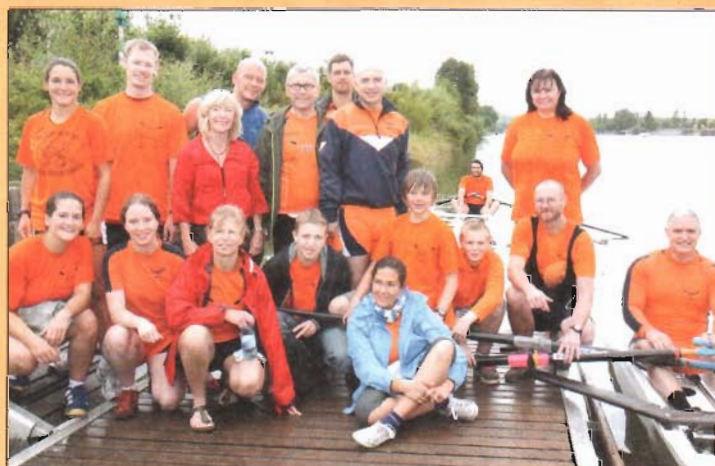
Der „Luxembourg International Rowing Club“ organisierte eine Ruderregatta auf der Mosel

For more details call on +352 621 42 15 78 or send an e-mail to signe.artgallery@gmail.com